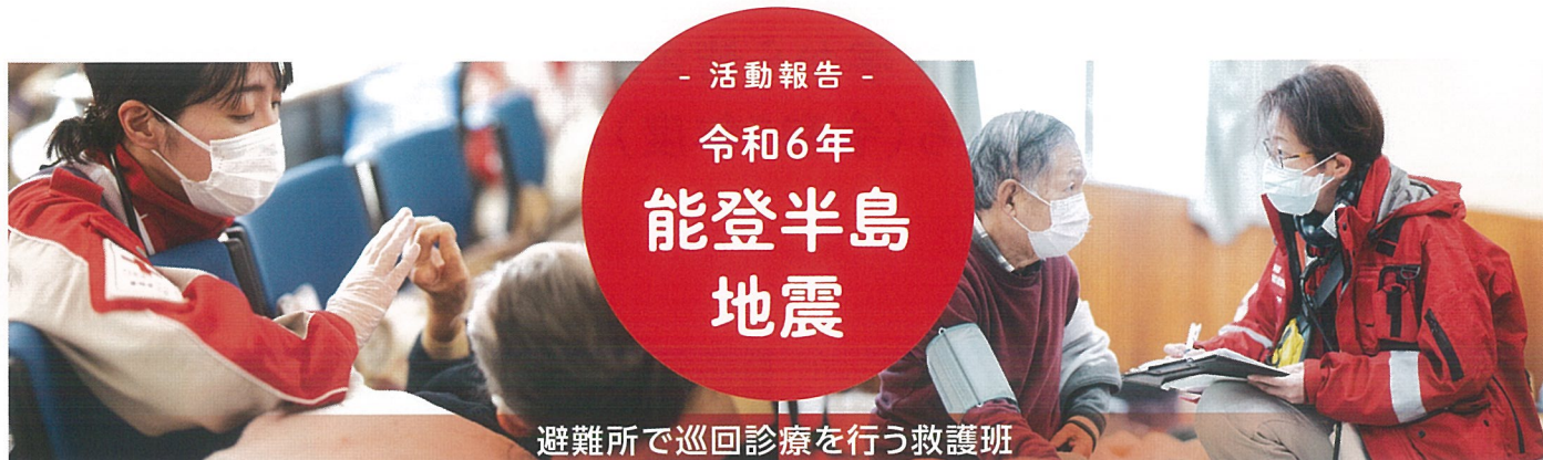
避難所で巡回診療を行う救護班