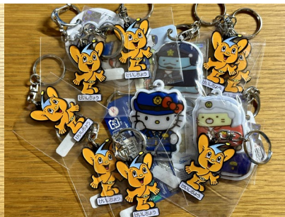
各種キャラクターグッズなど