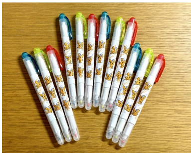
ピーポくん蛍光マーカー

クイズ台紙(右記)は、4/6～4/15の間は下五自治会の掲示板にぶら下げるので1人1枚ずつって 参加してください。なお、上記に掲載の日時以外は景品配布を行いませんのでご注意ください。