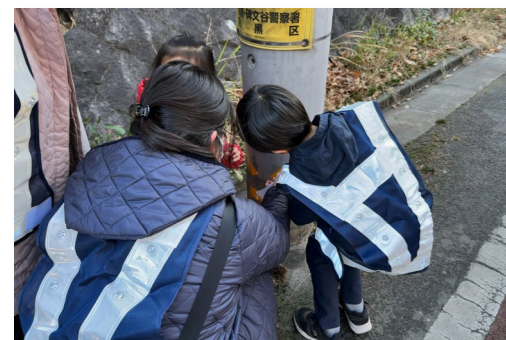
シールを貼り付けている様子

また、2/11(日)は、高齢者向けスマホ教室を行い、スマホで出来ることを参加者は熱心に学んでいました。