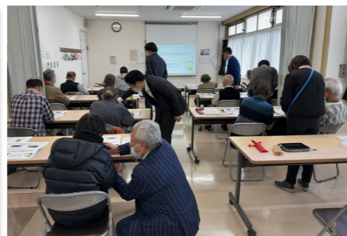
高齢者スマホ教室の様子