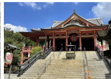
龍泉寺 (目黒不動尊)

【主催】 不動プロボノネットワーク(お問い合わせ: contact@fudou-probono.net 、担当: 沖)