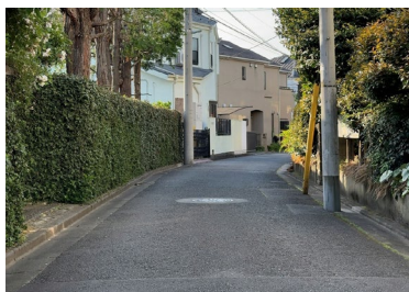
元競馬場周辺 (目黒区下目黒辺り)