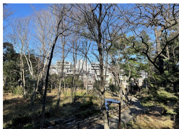
林試の森公園 (林業試験場跡地)