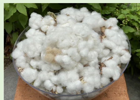
グリーンガーデンPJ (地域緑化活動：綿花栽培)