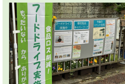
みんなのシェアで創るまちPJ (フードドライブ)