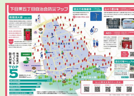
みんなで考える防災PJ (防災啓発活動：防災マップ)