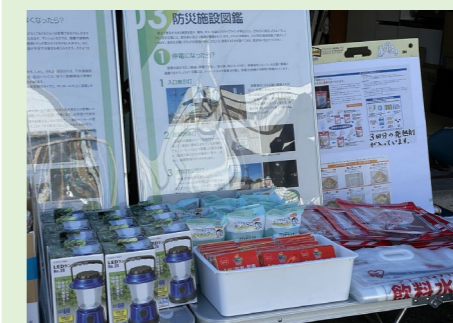
みんなで考える防災PJ (防災啓発活動：グッズ配布)