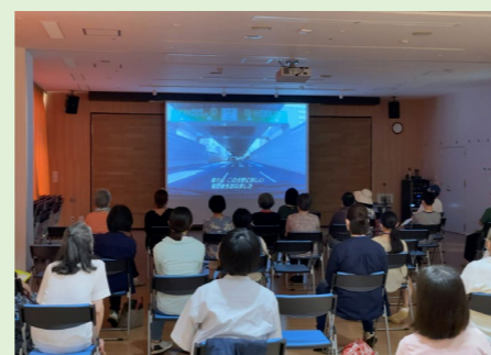
下五キャンパスPJ (映画上映会&SDGs講演会)